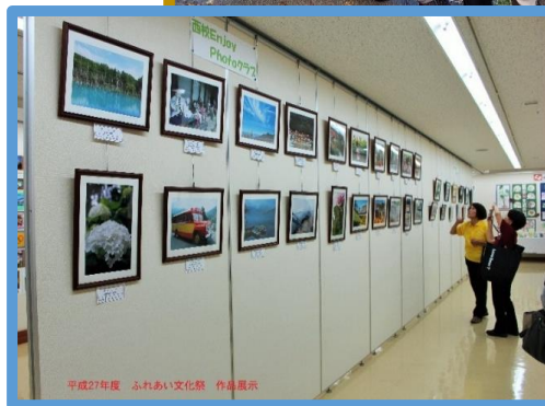
平成27年度 ふれあい文化祭 作品展示